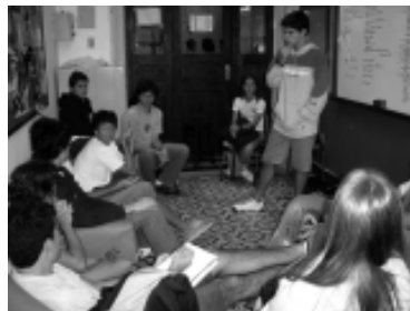
Sala do Grêmio, reformada com a ajuda de colaboradores do CSI: espaço para reuniões e desenvolvimento de novas parcerias.

previsto para dia 22/10, das 14h às 21h30, no CSI. As inscrições de bandas de alunos podem ser feitas até 16/09 (basta entregar um CD demo e R$ 15,00). Mais informações na sala do Grêmio.