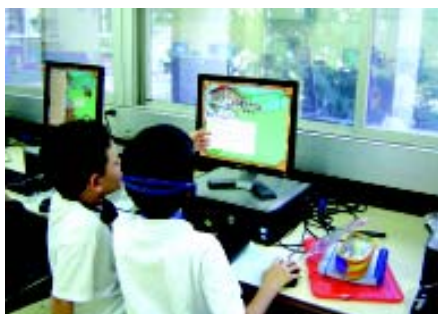
Pesquisa em DVD para a produção do vídeo sobre Inácio de Loyola.

Durante o mês de outubro, o 3F apresentará sua obra para os alunos das demais séries do EF1: o vídeo sobre a vida de Inácio de Loyola, contada pelas próprias crianças.