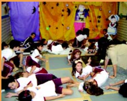
Alunos participam de atividade de um dos projetos apresentados no Simpósio: a Casa da Bruxa.

A equipe de educadores de J3 participou do II Simpósio de Educação Infantil em Santa Rita do Sapucaí nos dias 02, 03 e 04 / 10. O grupo apresentou alguns projetos desenvolvidos na série e trocou idéias sobre a formação e a aprendizagem de crianças nesta faixa etária. Todos os colégios Jesuítas da província Brasil Centro-Leste estiveram no evento. Nos dias do Simpósio, os alunos de J3 não tiveram aula.