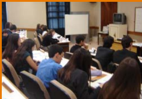
"Delegados" em debate nos comitês da ONU Colegial.

A 4ª ONU Colegial realizou-se entre os dias 24 e 27/09, período em que os alunos puderam simular reuniões baseadas em comitês reais. Os jovens do 9F ao 3M puderam escolher entre sete temas: Conselho de Direitos Humanos (CDH), que tratou de violações dos direitos humanos na China, Security Council (SC), em inglês, que discutiu a situação em Myanmar, Conselho Europeu (CE), onde foi discutida a adesão da Turquia à União Europeia, o Conselho de Segurança Histórico (CSH) que falou da questão da Iugoslávia em 1992, e o Fórum Econômico Mundial (FEM), onde os delegados trabalharam a implantação de biocombustíveis.