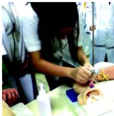
Alunos do 2M em visita à Universidade de Medicina de Petrópolis, em 29/09.