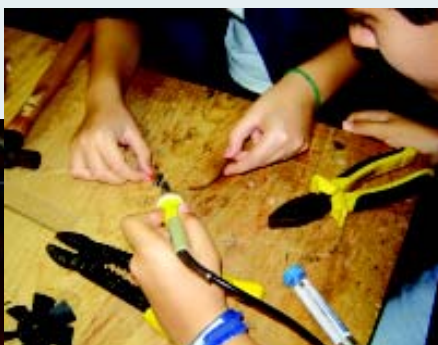
Protótipo feito por alunos: ROBESCOLA reunirá produções desenvolvidas ao longo do ano e um desafio entre máquinas

As máquinas, produzidas pelos alunos, e controladas por rádio-controle, fios ou sensores, se enfrentarão numa grande arena, montada no Centro Esportivo São Francisco Xavier. O objetivo é que, após o enfrentamento, as máquinas continuem se movendo.