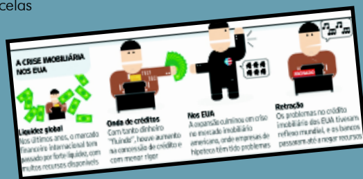
Esquema da Folha On Line: pesquisa em vários veículos para entender o assunto.

(em empréstimos subprime os juros não são fixos). Muitos mutuários desistiram das casas, porque não iam ter como pagar e a devolveram aos bancos. O efeito da crise é mundial porque, para cobrir o rombo, as empresas tiram dinheiro de outros investimentos e isso gera problemas em todo o mundo.