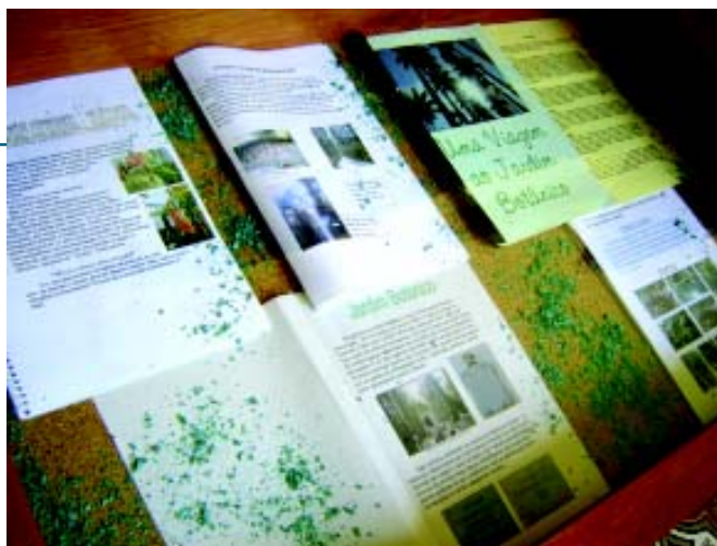
Fotografias feitas pelos alunos do 7F compõem o mural, em exposição no corredor do térreo.

O 7F fez uma pesquisa de campo, em outubro, no Jardim Botânico, que este ano comemora seu bicentenário. A atividade proporcionou o trabalho sobre a diversidade vegetal e permitiu ao grupo um conhecimento maior da história botânica do país. Os jovens, divididos em grupos, visitaram várias aléias do parque, fotografando as diversas espécies vegetais e coletando informações, usadas em um trabalho de grupo.