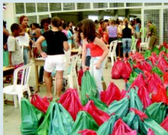
Cestas de Natal montadas pela Comunidade Educativa: doações são revertidas em um Natal MAIS Feliz para muitas famílias.