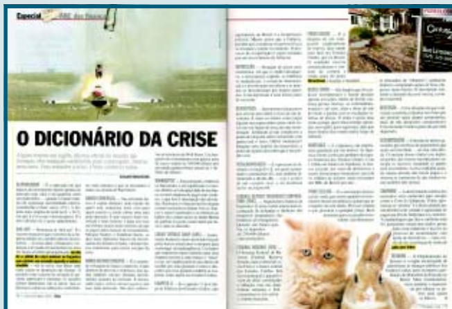
O Dicionário da Crise, a publicação da Veja é uma das matérias que compõem o material.

O projeto que envolve a produção de material pelos alunos do EMJ para uso na tutoria ainda está em fase experimental. O objetivo é criar alternativas para estimular os alunos a acompanharem e entenderem o noticiário e ficarem a par do que acontece na sociedade.