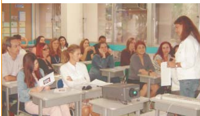
Reuniões de pais: importante momento para que as famílias ocupem seu espaço na escola