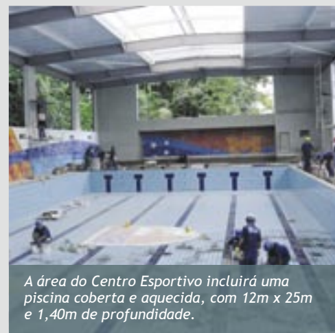
A área do Centro Esportivo incluirá uma piscina coberta e aquecida, com 12m x 25m e 1,40m de profundidade.