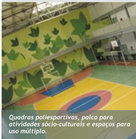
Quadras poliesportivas, palco para atividades sócio-culturais e espaços para uso múltiplo.

de área construída, o CESI oferece espaços apropriados para as práticas esportivas e de integração dos alunos. Saiba mais sobre as novas instalações.