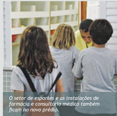
O setor de esportes e as instalações de farmácia e consultório médico também ficam no novo prédio.