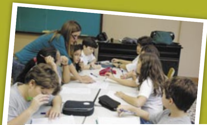
Reunião para elaboração do plano de ação do projeto: alunos participam de todas as etapas, desde as decisões até a execução.