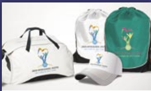
Todos os participantes receberão um kit personalizado e comemorativo dos jogos.