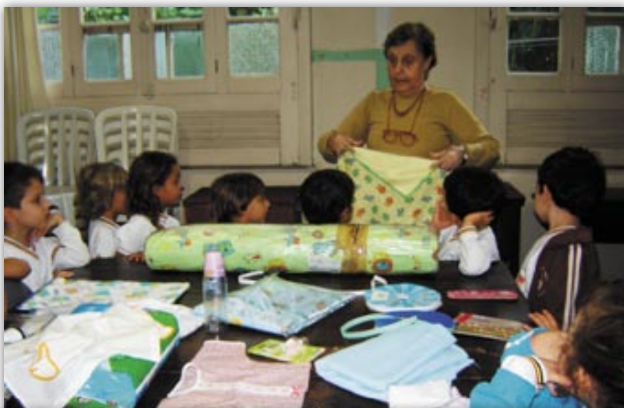
Pré na Ação Claveriana (Acla), onde são feitos enxovais para famílias do Santa Marta.

o desprendimento e a solidariedade para com o próximo, ajudará o Natal MAIS Feliz e Solidário e as crianças da ONG Harmonicanto, do Cantagalo. Informações sobre a Harmonicanto: http://harmonicanto.multiply.com/