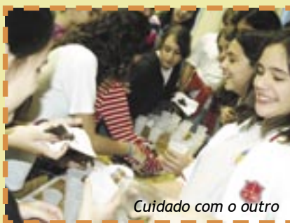
Cuidado com o outro

A coordenadora e o orientador da série passaram nas turmas explicando o projeto e convidando os alunos a se inscreverem nas aldeias de preferência e escolherem seus representantes. São cinco aldeias por turma, cada uma com objetivos específicos. Em 07/05, cada aldeia se reunirá com os professores para discutir o Plano de Ação.