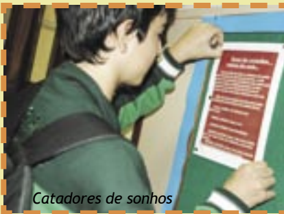
Catadores de sonhos