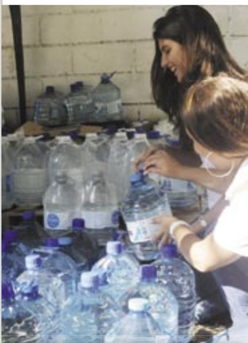
A Diretoria do CSI agradece à Comunidade Educativa pela colaboração na campanha.