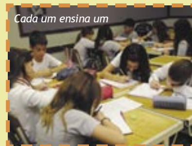
Cada um ensina um

A coordenadora e o orientador da série passaram nas turmas explicando o projeto e convidando os alunos a se inscreverem nas aldeias de preferência e escolherem seus representantes. São cinco aldeias por turma, cada uma com objetivos específicos. Em 07/05, cada aldeia se reunirá com os professores para discutir o Plano de Ação.