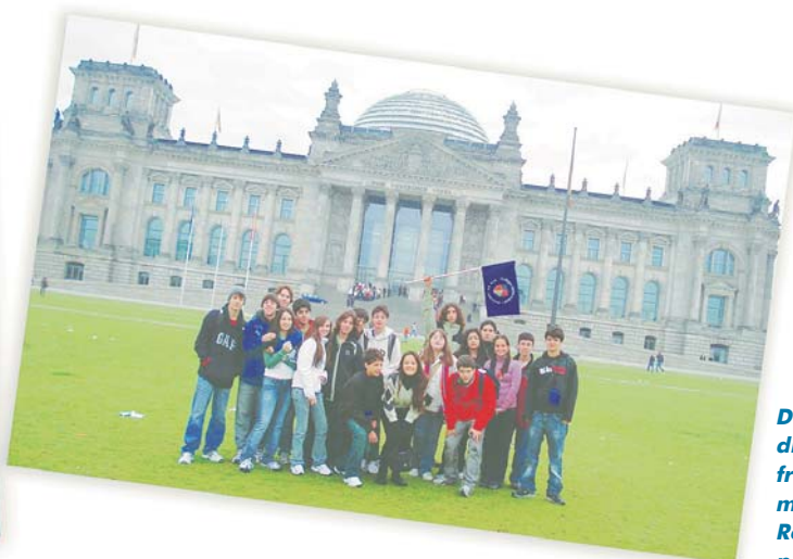
Da esquerda para a direita, alunos em frente a uma parte do muro de Berlim e ao Reichstag, o parlamento alemão.