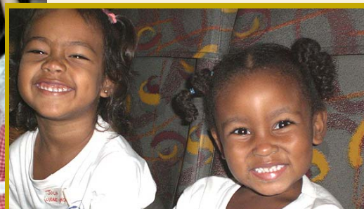
As crianças da UNAPE foram ao cinema, em abril, acompanhadas por voluntários.