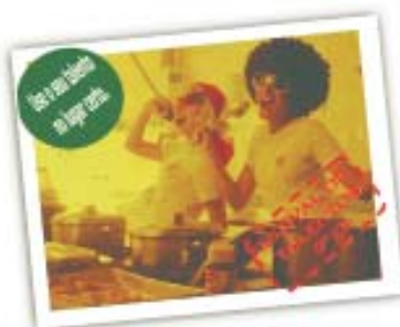
Ilustração: Lucélia Rorha

Cartaz do Festival do 9º ano: alunos apresentarão seus talentos.