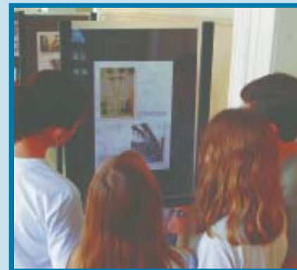
Alunos observam imagens do Rio antigo.

A influência da Família Real no Rio também foi tema de uma exposição com imagens da cidade antes e depois da chegada dos portugueses.