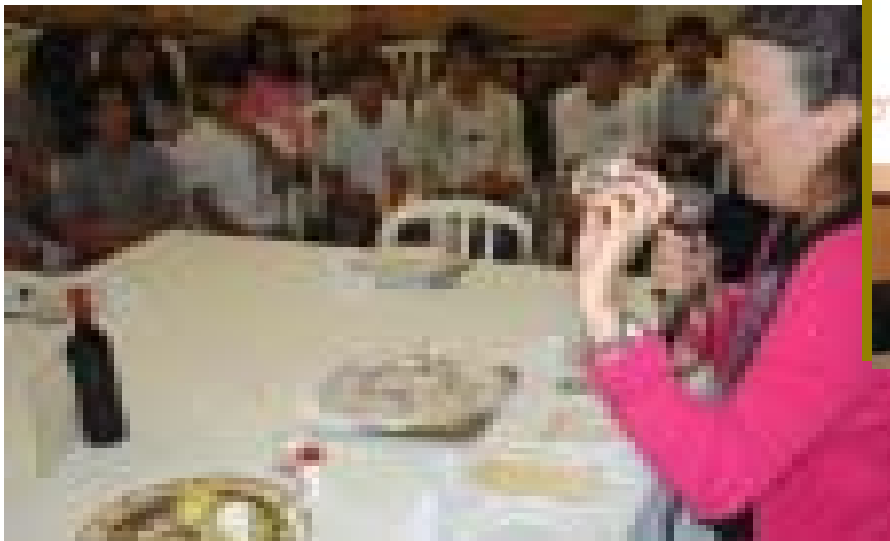
Alunos assistiram a rituais judaicos, como Pessach, e fizeram um telejornal.

Os alunos do 6F desenvolveram durante o segundo bimestre um trabalho integrado entre Artes, Ensino Religioso e História, sobre a cultura judaica e o Egito Antigo. Os alunos assistiram a um filme sobre o tema, fizeram maquetes sobre rituais judaicos e apresentaram um telejornal sobre o assunto.