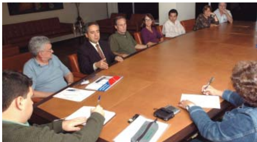
Reunião para decidir os detalhes das atividades propostas pelo CSI a casais pais de alunos e educadores.

Em 11/08, os educadores do CSI, docentes e não-docentes, participarão da Jornada Inaciana, atividade também proposta aos pais, principalmente de 1ª, em 02/06. Assim como as famílias, os educadores terão momentos de reflexão, aprofundamento, convivência e oração, podendo compreender e experimentar a espiritualidade que move e inspira o cotidiano da prática educacional do CSI.