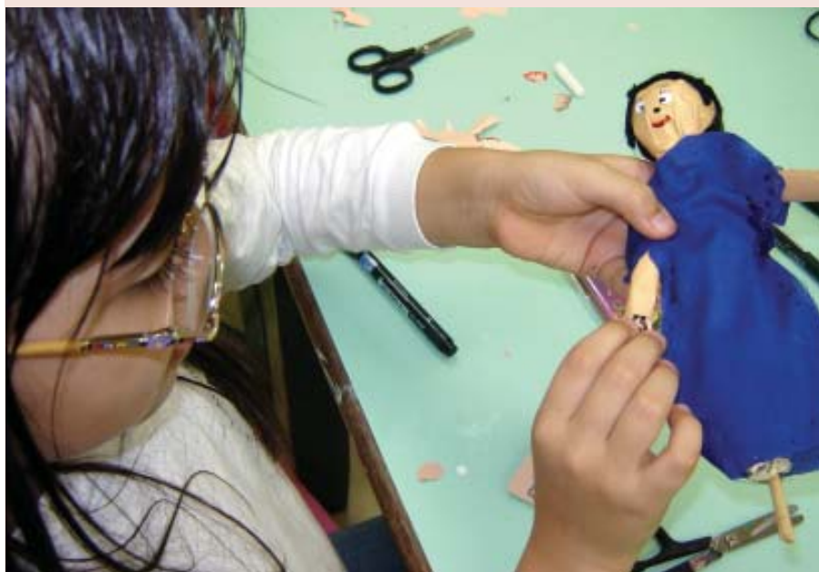
Alunos de 1F confeccionam os bonecos para contar em vídeo a história de Santo Inácio

que oferece às crianças o conhecimento sobre outras culturas; Fábulas, que tem como produto final um livro publicado com as histórias dos alunos; Água, no qual os alunos conversam sobre a importância deste recurso natural; Amazônia, que apresenta a cultura e os valores dos povos locais aos alunos; e ainda o projeto História de Santo Inácio, que permite às crianças produzir um vídeo sobre a vida de Inácio.