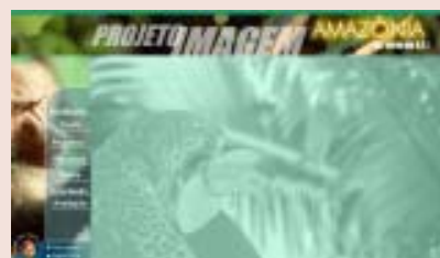
Nos projetos Água (3F) e Amazônia (4F), os recursos virtuais são fundamentais para promover a discussão de temas relacionados à ecologia e sustentabilidade.