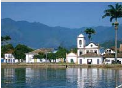
Paraty: fundada em 1667, a cidade é Patrimônio Histórico Nacional

Os alunos de 8F estarão em Paraty, nos dias 13, 14 e 15/04. Durante a viagem, os jovens, acompanhados pelos professores, trabalharão aspectos das disciplinas envolvidas no passeio: história, geografia, artes e ciências. Estão programadas, dentre outras atividades, visitas ao Caminho do Ouro, ao Centro Histórico e ao Centro Cultural de Paraty. Os alunos sairão do CSI às 6h de 13/04 e retornarão às 19h de 15/04. O custo é de R$ 528,00.